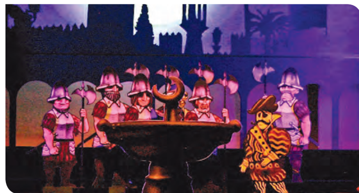
Festival Géo Condé, théâtre Gérard Philipe de Frouard

Le festival de marionnettes Géo Condé du théâtre Gérard Philipe participe au rayonnement de la communauté de communes bien au-delà de son territoire.