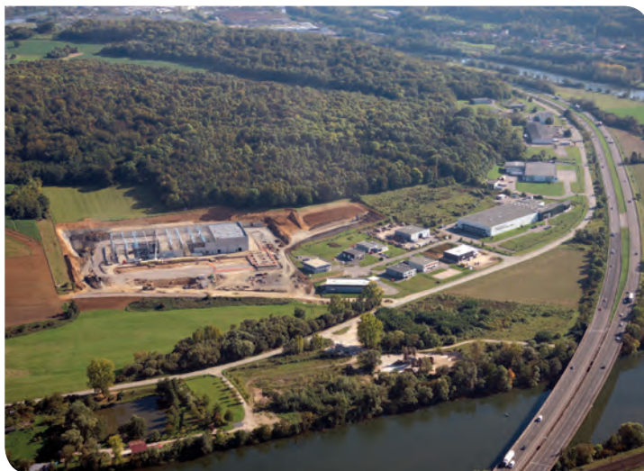
Les Sablons à Millery