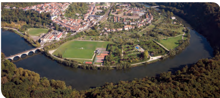
La boucle de la Moselle de Liverdun