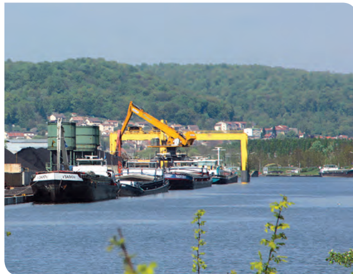
Le port de Frouard