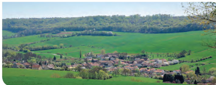
Vallée verte de la Mauchère