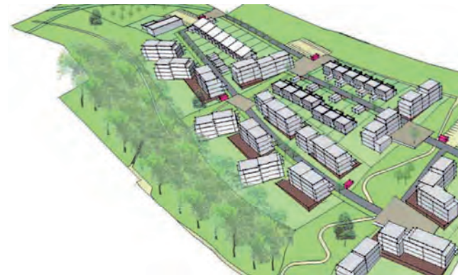
La Croix des Hussards à Frouard