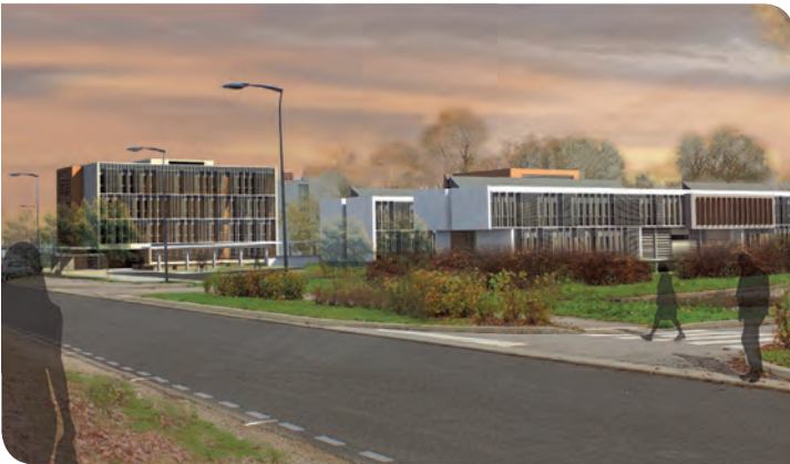
Projet pôle tertiaire sur le Parc Eiffel Énergie

Le Bassin de Pompey développe un pôle tertiaire, projet immobilier d'envergure destiné à accueillir des activités professionnelles, des entreprises, des espaces de formation, des services... alliant mutualisation des espaces et qualité environnementale.