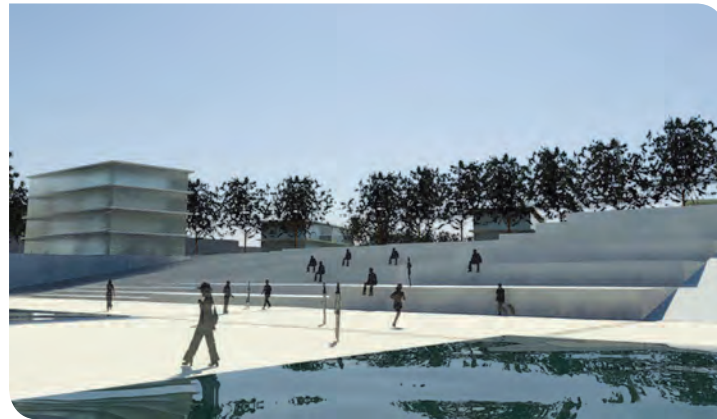
Saint-Gobain à Liverdun : respect du patrimoine au cœur d'un projet urbain