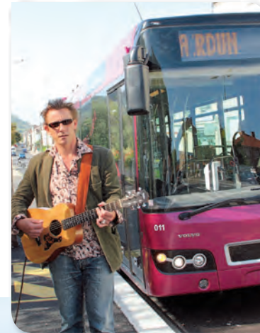
Le SIT - Service Intercommunal de Transport