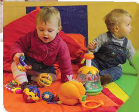
Structure multi-accueil de Champigneulle