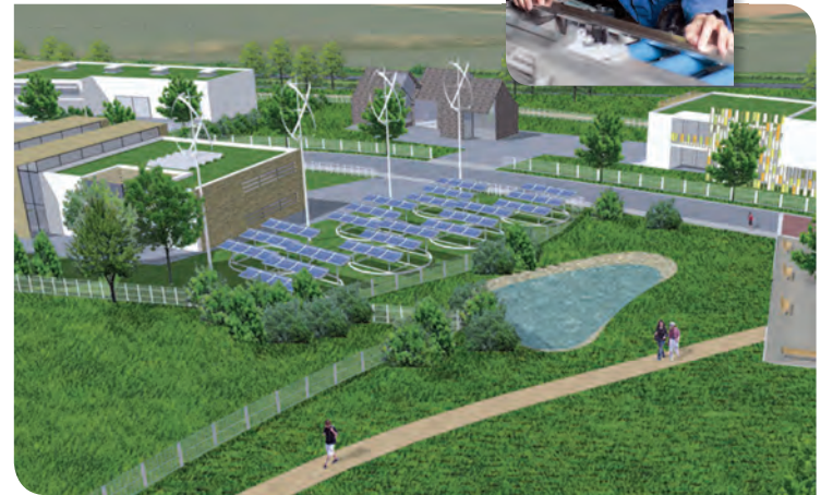
Sur le plateau : zone artisanale de la Haute Épine à Saizerais

Avec 4 000 salariés et 120 entreprises, premier parc urbain et technologique lorrain porteur de la labellisation environnementale ISO 14001, le Parc Eiffel Énergie est une force industrielle remarquable. Il caractérise aujourd'hui l'identité économique du Bassin de Pompey. Plus largement, la politique de développement économique a permis l'implantation et le maintien des entreprises sur le territoire, avec une occupation presque intégrale des zones d'activités du Bassin. L'économie productive s'appuie sur une diversité de TPE et PME autour de quelques gros employeurs locaux (Délipapier, Brasseries de Champigneulle, Leclerc, Novasep, Crown Bevcan, etc.) favorisant ainsi une stabilité de l'emploi.