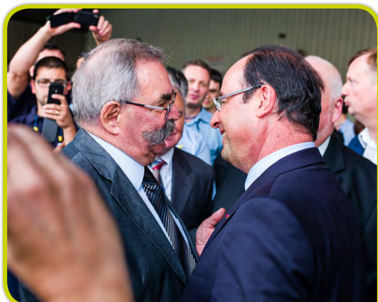
Jacques Chérèque accueille François Hollande le 26 septembre 2013 à l'occasion de sa venue sur le Bassin de Pompey.